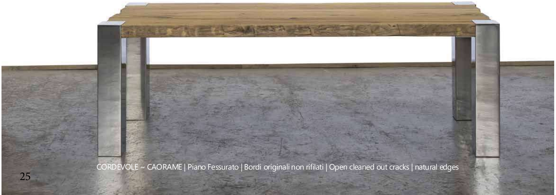
CORDEVOLE ~ CAORAME | Piano Fessurato | Bordi originali non rifilati | Open cleaned out cracks | natural edges

Varnished using water paint (raw effect) or oiled. Waterproof. Tubular 150x150mm glossy steel leg - AISI 304 – Adjustable feet