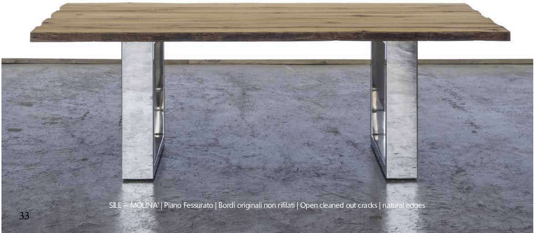
SILE ~ MOLINA' | Piano Fessurato | Bordi originali non rifilati | Open cleaned out cracks | natural edges

Varnished using water paint (raw effect) or oiled. Waterproof. Tubular glossy steel leg - AISI 304 – Adjustable feet