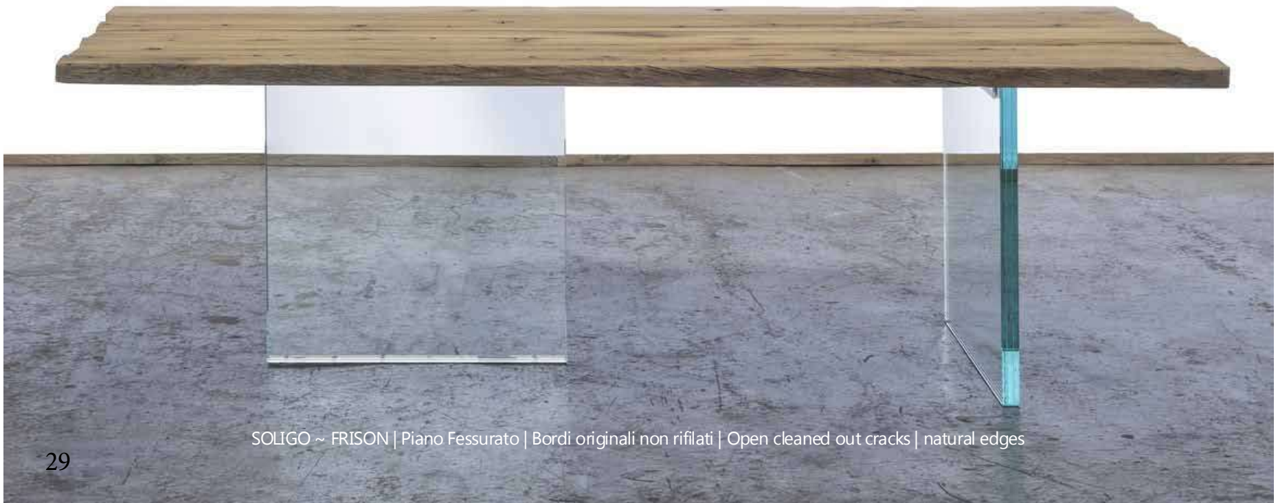
SOLIGO ~ FRISON | Piano Fessurato | Bordi originali non rifilati | Open cleaned out cracks | natural edges

Varnished using water paint (raw effect) or oiled. Waterproof. Extra light glass legs W 700mm x H 690mm