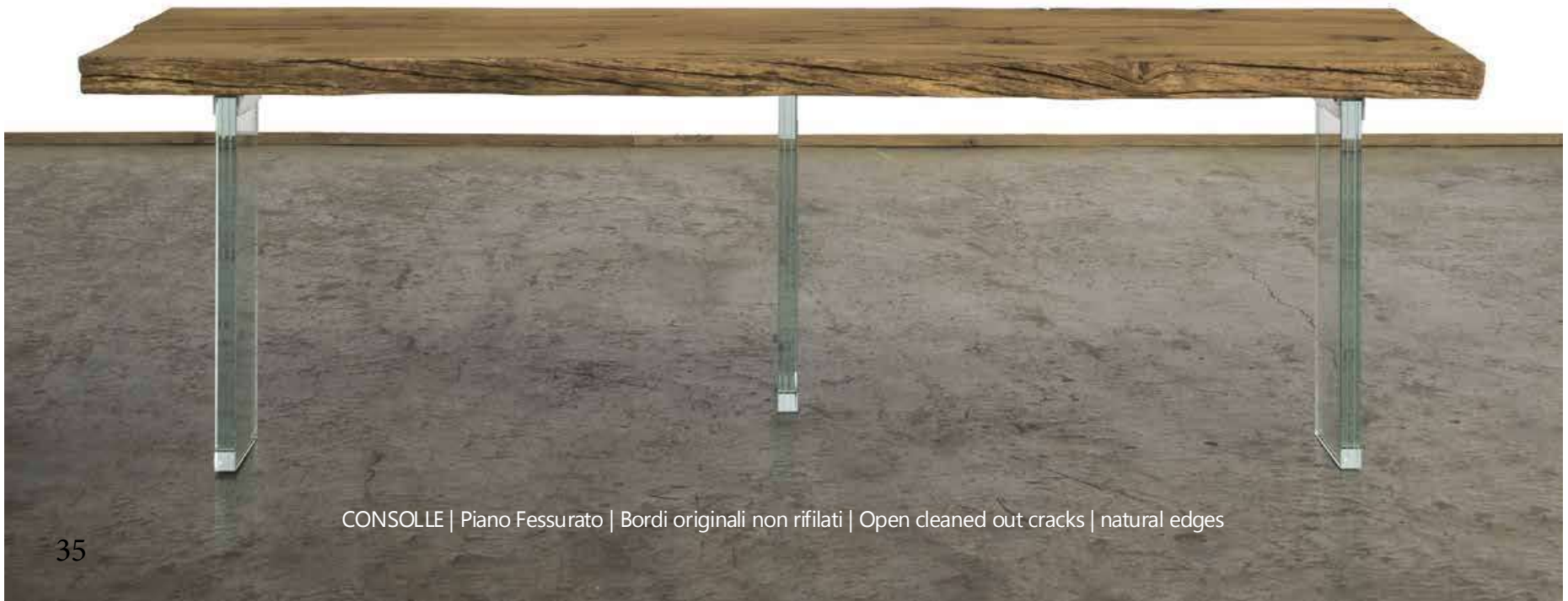
CONSOLLE | Piano Fessurato | Bordi originali non rifilati | Open cleaned out cracks | natural edges

Varnished using water paint (raw effect) or oiled. Waterproof. Extra light glass leg W 200mm x H 690mm