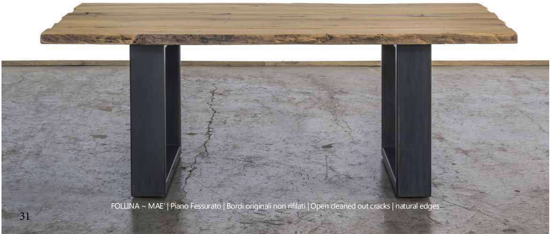
FOLLINA ~ MAE' | Piano Fessurato | Bordi originali non rifilati | Open cleaned out cracks | natural edges

Varnished using water paint (raw effect) or oiled. Waterproof. Charcoal grey varnished iron legs W700 mm x H 690mm