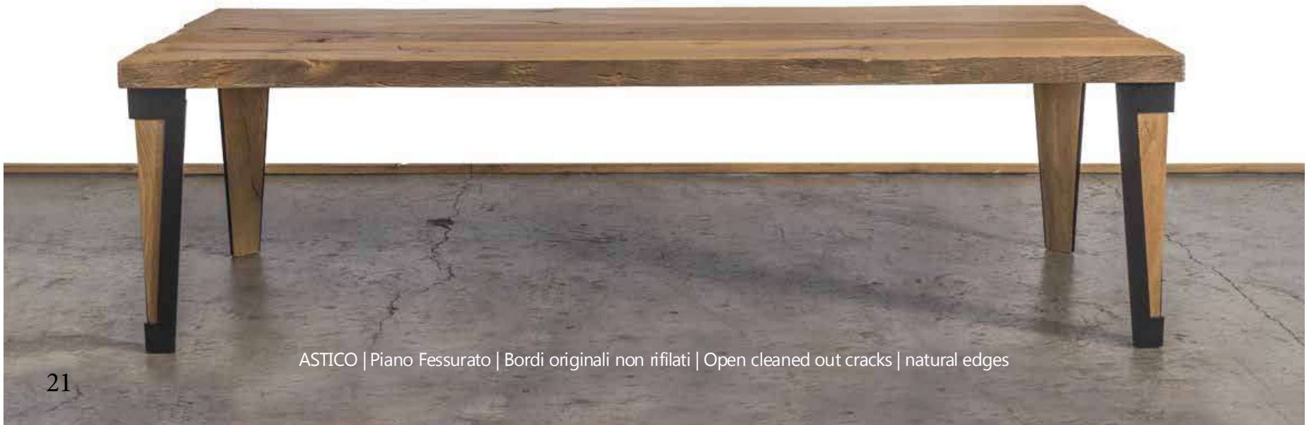
ASTICO | Piano Fessurato | Bordi originali non rifilati | Open cleaned out cracks | natural edges

Varnished using water paint (raw effect) or oiled. Waterproof. Corner legs made of plain oak and charcoal grey varnished iron. Adjustable feet