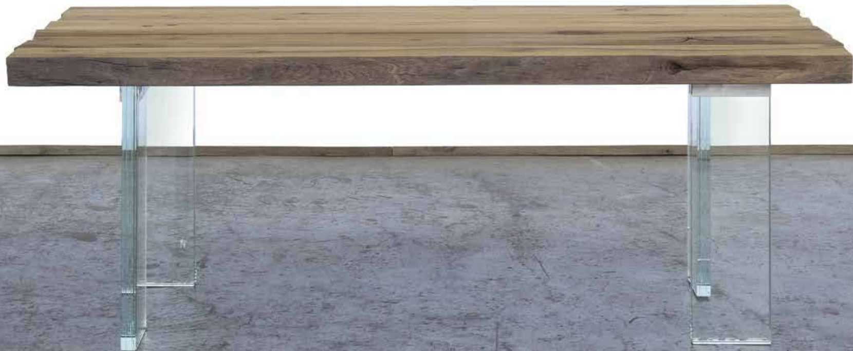
BOITE ~ ANSIEI | Piano Fessurato | Bordi originali non rifilati | Open cleaned out cracks | natural edges

Varnished using water paint (raw effect) or oiled. Waterproof. Extra light glass legs W 200mm x H 690mm