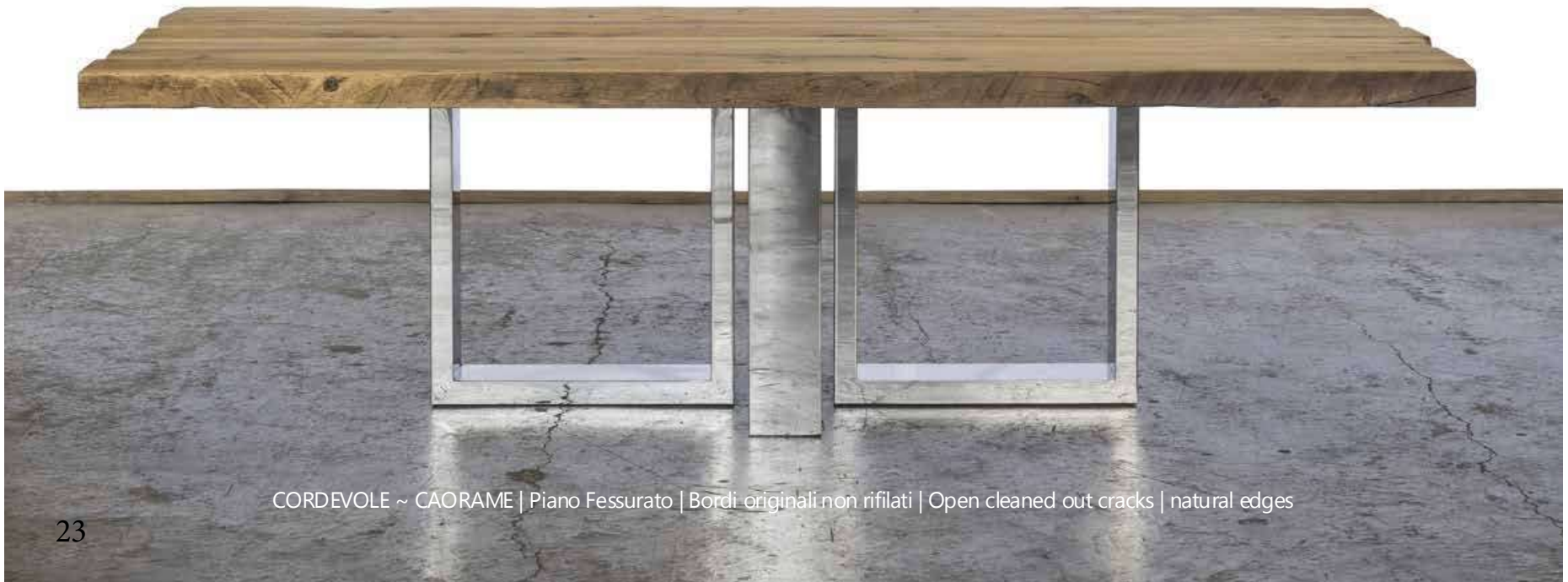
CORDEVOLE ~ CAORAME | Piano Fessurato | Bordi originali non rifilati | Open cleaned out cracks | natural edges

Varnished using water paint (raw effect) or oiled. Waterproof. Tubular glossy steel leg - AISI 304 . Adjustable feet