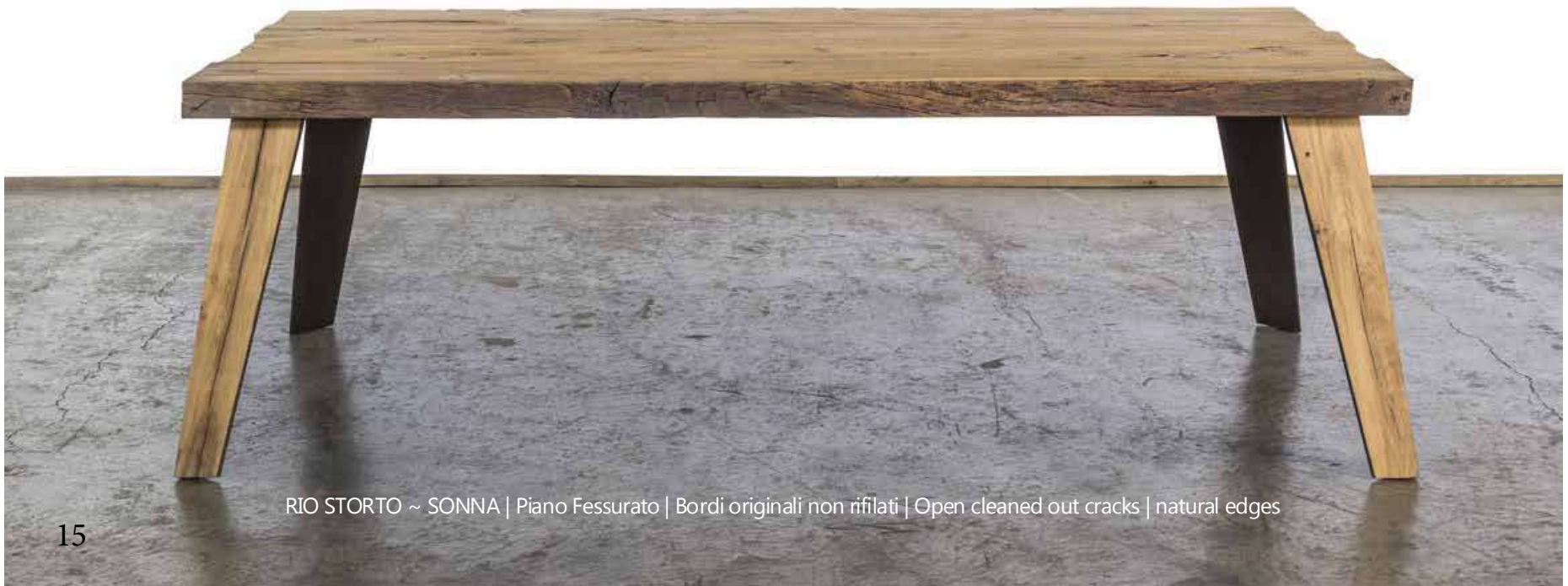
RIO STORTO ~ SONNA | Piano Fessurato | Bordi originali non rifilati | Open cleaned out cracks | natural edges

Varnished using water paint (raw effect) or oiled. Waterproof. Corner legs made of plain oak and charcoal grey varnished iron . Adjustable feet