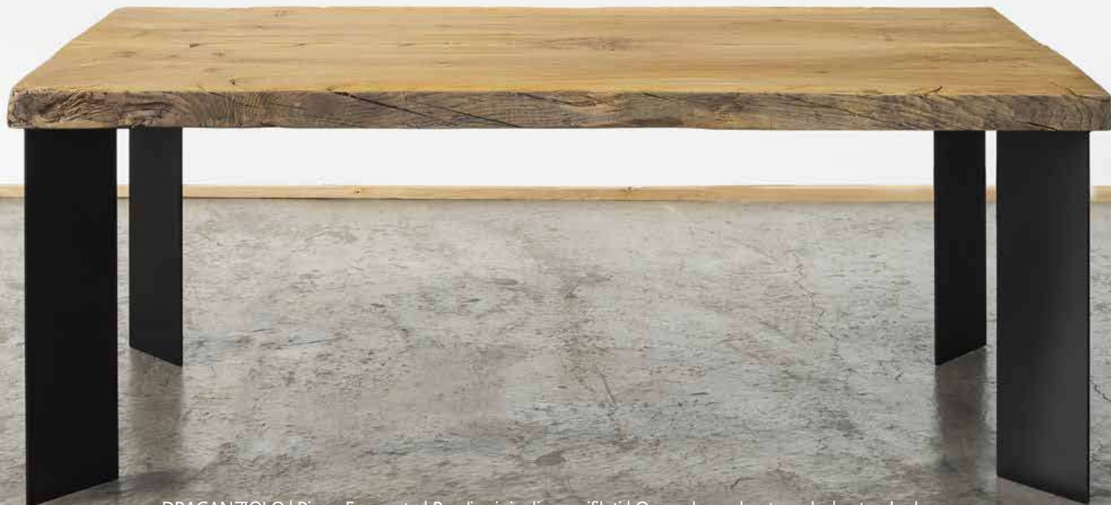
DRAGANZIOLO | Piano Fessurato | Bordi originali non rifilati | Open cleaned out cracks | natural edges

Varnished using water paint (raw effect) or oiled. Waterproof. Charcoal grey varnished iron blade leg